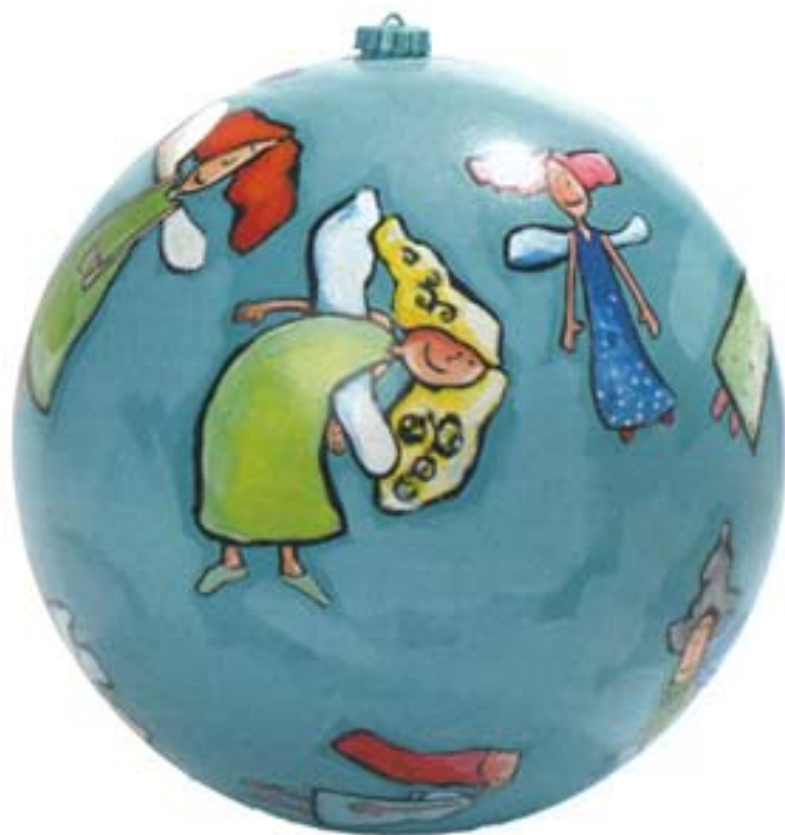
5. Sonja Reus is afgestudeerd aan Academie Minerva in Groningen. Ze maakt zowel vrij werk als illustraties in opdracht. www.sonjareus.nl