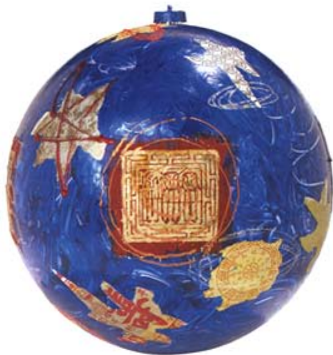
8. Neely Schaap maakt assemblages, objecten, keramieken en schilderijen. Een diep vrijheidsgevoel is een belangrijke inspiratiebron voor haar werk. www.neelyschaap.nl