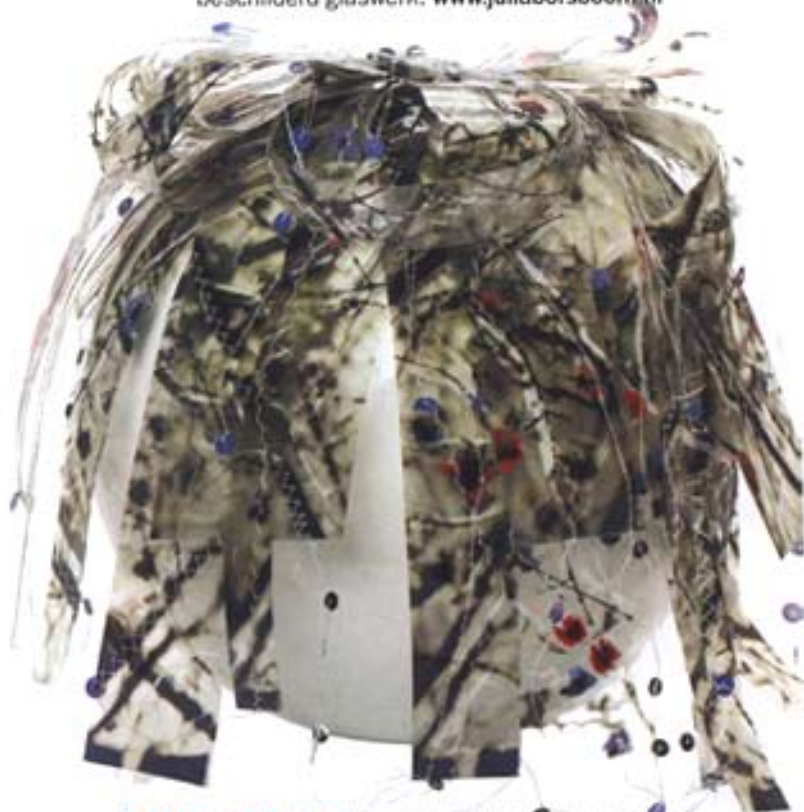
9. Yvette Winkler is naast beeldend kunstenaar ook werkzaam als docent Beeldend en Fotografie in het basis- en voortgezet onderwijs. www.yvettew.nl