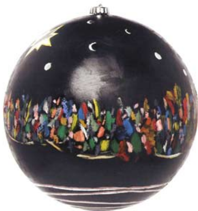
13. Joke Theunisz-Pater tekende als kind al graag. Twintig jaar geleden begon zij met olieverf.